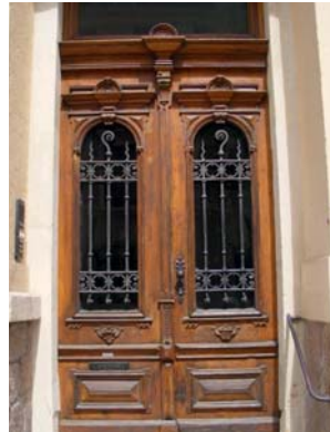
Vergitterung der Hauseingangstür, Tzschirnerplatz 7, 1895/2015