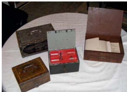
Geldkassetten verschiedenen Dekors, um 1930