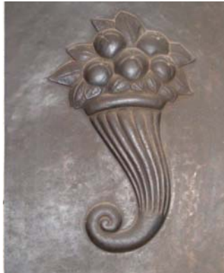
Füllhorn mit Blumen, Treibarbeit Teil der Meisterarbeit von 1928