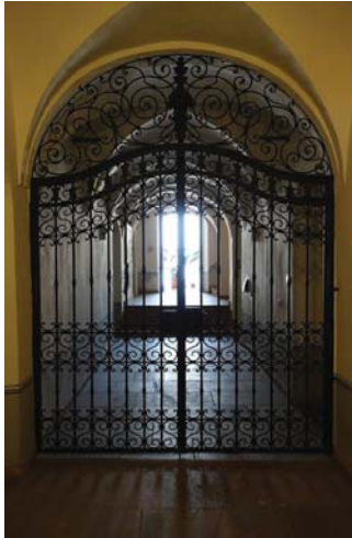
Neobarockes Gitter im Rathaus 2, um 1928

Alle Abbildungen sind Produkte der Firma Meininger/Backofen.