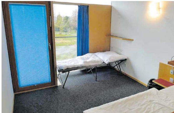
Blick in eines der Zimmer im Ankunftszentrum in Waldheim.

Flüchtlinge privat im Landkreis untergebracht haben, erhalten fünf Euro pro Person und Tag. Dies gilt sowohl für Kinder als auch Erwachsene. Mit der Höhe orientiert sich der Kreis am Niveau der Kostenübernahme durch andere Landkreise. Das Verfahren gilt für ukrainische Geflüchtete, die nach dem 24. Februar 2022 eine pri-