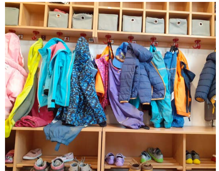
Auch in diesem Jahr steht Fördergeld für Investitionen in Kitas zur Verfügung.

Euro ein, der Fördermittelbedarf ist auf rund 1,1 Millionen Euro beziffert. Aufgrund der Überzeichnung des Budgets beschlossen die Mitglieder des Jugendhilfeausschusses eine Reserveliste. Auf dieser steht die Mockritzer Kita „Kleine Weltentdecker“.