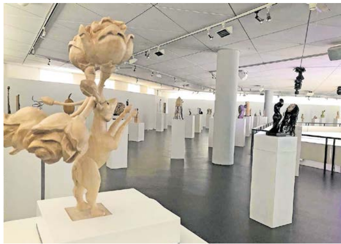
Diese Holzkunstwerke sind im Schloss Rochsburg bis Ende Juli zu sehen.