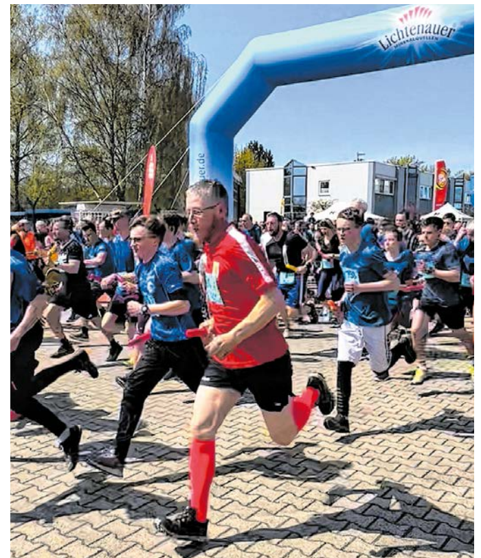
120 Staffeln sind im Hauptlauf an den Start gegangen. Gastgeber des 30. Landkreislafes war die Gemeinde Lichtenau. Wechselzone sowie Start und Ziel waren auf dem Werksgelände der Firma Lichtenauer.

1993 gab es den ersten Landkreislaf im Altkreis Hainichen. 13 Staffeln liefen von Hainichen über Frankenberg nach Mittweida. Unterdessen sind es jedes