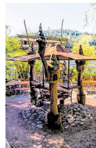
Einer von zwei Workshops findet im Baumhaushotel statt.

Das Projekt wird im Rahmen des Modellvorhabens „Aktive Regionalentwicklung“ vom Bundesamt für Bauwesen und Raumordnung gefördert, von der Wirtschaftsförderung des Landkreises Mittelsachsen und in deren Auftrag das Projektmanagement von M&M | Maikirschen & Marketing umgesetzt. Ansprechpartner für alle Fragen