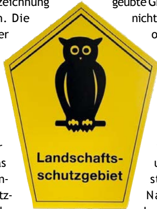
Dieses Schild kennzeichnet Flächennaturdenkmale.

Der Landkreis Mittelsachsen ist als untere Naturschutzbehörde neben der Ausweisung von naturschutzrechtlichen Schutzgebieten und -objekten auch für deren Kennzeichnung verantwortlich. Die Beschilderung der Schutzgebiete wird im Jahr 2022 durch die untere Naturschutzbehörde im Landkreis weiter fortgesetzt. Das Aufstellen und Anbringen der gesetzlich vorgeschriebenen Kennzeichen ist entsprechend des Sächsischen Natur-