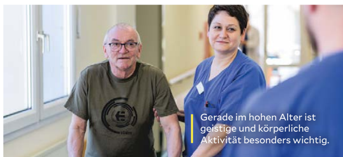
Gerade im hohen Alter ist geistige und körperliche Aktivität besonders wichtig.

Mit zunehmendem Alter sollten Menschen sich nicht im Sessel zurücklehnen und sich schonen, „weil sie jetzt ja alt sind“. Stattdessen ist Aktivität, entsprechend dem individuellen Gesundheitszustand, wichtig. Wir besprechen die wichtigsten Alters-Mythen.