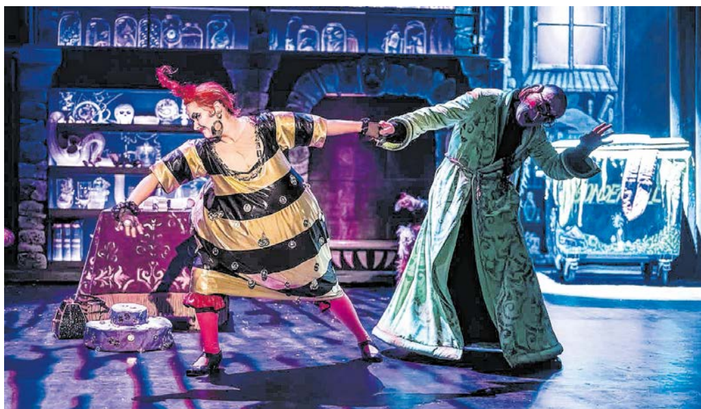
Michael Endes „Wunschpunsch“ wird wieder aufgeführt.