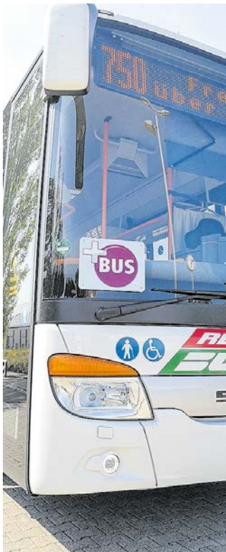
Bei REGIOBUS können die Anträge zum Bildungsticket gestellt werden.

Eltern von mittelsächsischen Kindern und Jugendlichen, die den Öffentlichen Personennahverkehr (ÖPNV) zur Schülerbeförderung nutzen, können jetzt das Bildungsticket beantragen. Dies soll bei der REGIOBUS Mittelsachsen GmbH als Verkehrsunternehmen erfolgen. Schon jetzt stehen die notwendigen Formulare auf der Internetseite des Verkehrsunternehmens unter www.regiobus.com zur Verfügung.