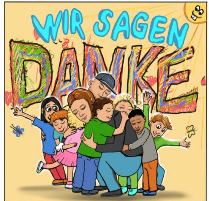
Auszug aus dem Motiv der Aktion.

Mitte April 2022 wurden über 800 Ansprechpartner, darunter Kindertagesstätten, Tagesmütter, Schulen, Beratungsstellen, Vereine und sonstige Institutionen, die